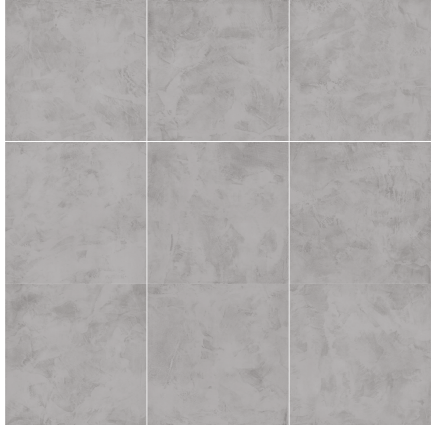
Cloud 120x120/48"x48" R