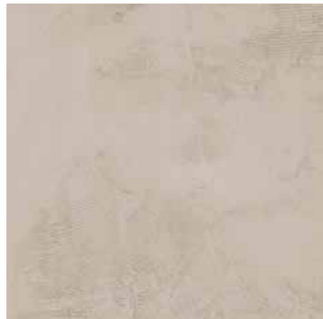
Tan 120x240/48"x96" R ME53 120x120/48"x48" R ME82 60x120/24"x48" R MF93 60x60/24"x24" R ME90 30x60/12"x24" R MF86