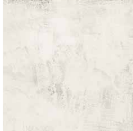
Rice 120x240/48"x96" R ME52 120x120/48"x48" R ME81 60x120/24"x48" R MF92 60x60/24"x24" R ME89 30x60/12"x24" R ME93