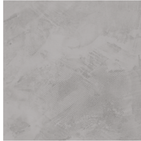
Cloud 120x240/48"x96" R ME50 120x120/48"x48" R ME79 60x120/24"x48" R MF90 60x60/24"x24" R ME87 30x60/12"x24" R ME91